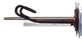
Antical y de larga duración