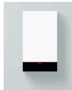
Vitodens 100-W (B1HF y B1KF)