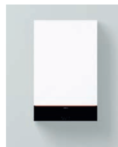
Vitodens 111-W (B1LF)