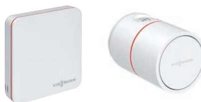
Termostato y cabezal termostático inteligente ViCare para mayor comodidad y eficiencia

Con la aplicación ViCare, controle la calefacción de manera muy cómoda y ahorre energía, en cualquier momento y desde cualquier lugar.