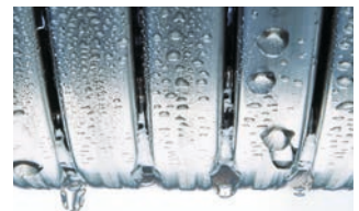
Intercambiador de calor Inox-Radial de acero inoxidable